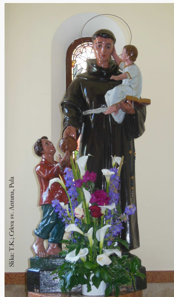
Slikar: T. K. crkva sv. Antonia, Pula

Sveti Antun Padovanski, svetac čitavoga svijeta rođen je 1195. godine u Lisabonu u Portugalu a umro je 13. lipnja 1231. godine u Arcelli kod Padove u Italiji. Zaštitnik je mnogih župa i crkava kao i naše crkve u Waiblingenu i naše zajednice u Backnangu.